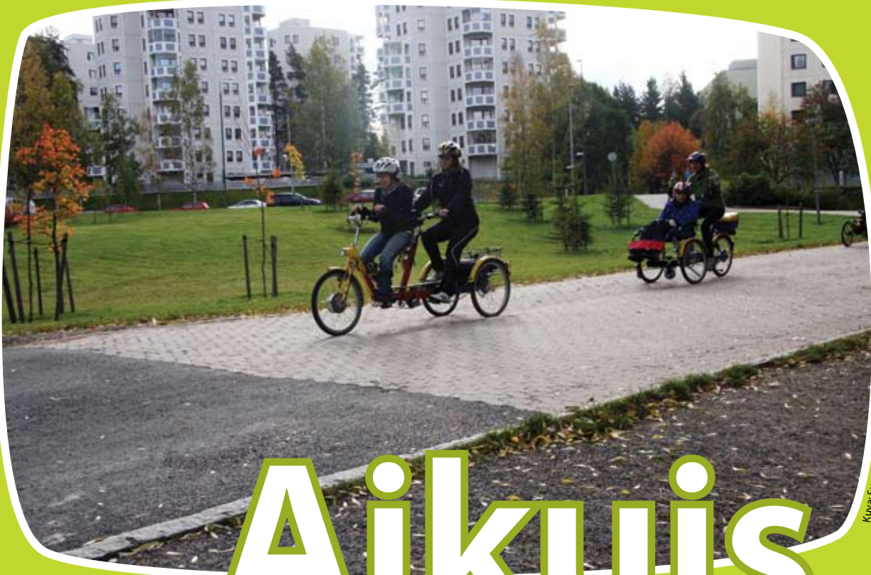
Kuva: Susanna Tero