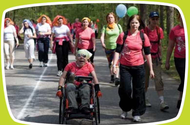
Kaikki likat lenkillä Tampereen Pyynikin maastoissa toukokuussa 2009.

Valmistautumiseen kuului myös katsomossa ja muual- la käytettävien luiskien kaltevuuden tarkastamista, esteet- tömien vessojen miettimistä, taukoteltan varustamista, so- velletun reitin mäkien jyrkkyyden testaamista ja huoltajien löytämistä sovelletulle reitille.