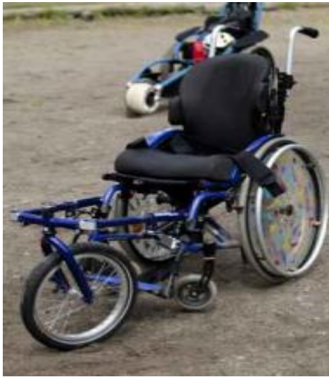
KUVIO 5. Nokkapyörä

Nokkapyörä (MTC tai Sticker Lomo) (KUVIO 5) on pyörätuolin eteen kiinnitettävä lisäpyörä, joka nostaa pyörätuolin pienet tukipyörät ilmaan. Siten pyörätuolilla liikkuminen maastossa on helpompaa. Tukipyörien noston myötä kivien ja kantojen ylittäminen helpottuu ja liikkuminen sohjossa ja pehmeässä maastossa on kevyempää. Nokkapyörä voidaan kiinnittää pikalukituksella jalkatukiputkiin silloin kun pyörätuolissa on kiinteät jalkatuet. Jos pyörätuolissa on irrotettavat jalkatuet, nokkapyörä kiinnitetään pyörätuolin runkoon. (Välineet.fi 2011.)