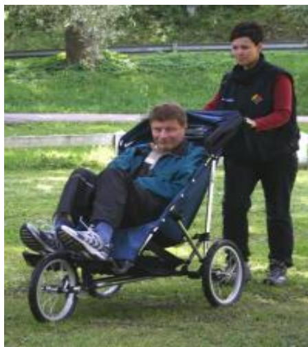
KUVIO 10. Juoksurattaat (Kuva: Malike)

den yli. Seisontajarrujen ollessa kytkettyinä, voi istuinosalla levätä. Rollaattori voidaan taitaa kokoon ja purkaa osiin. (Välineet.fi 2011.)