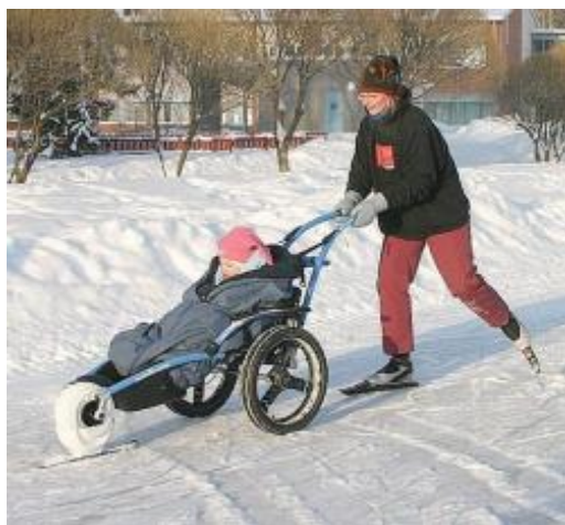
KUVIO 7. Hippocampella voi liikkua kesällä ja talvella

Maastopyörätuoleja on monia eri malleja, joissa maasto-ominaisuudet on huomi- oitu pyörien leveydellä, jousituksella ja muilla rakenteellisilla ominaisuuksilla. Hippocampe (KUVIO 7) on yksi Maliken vuokratuimmista maastopyörätuoleista. Se on kolmirenkainen kevyt monitoimituoli, jolla voi liikkua avustettuna työntäen työntöaisalla ja/tai vetäen vetonarulla. Se kelluu tyhjänä ollessaan vaikka veneen perässä. Purettuna tuoli mahtuu jääkiekkokassiin ja sen paino on vain 16 kg. Sitä on saatavissa neljää eri kokoa käyttäjän koon mukaan. Tuolin istuin on melko kuppimainen ja siinä on kaksi turvavyötä. Lisävarusteina ovat saatavissa kä- sinojalliset sivutuuet, niskatuki ja neopreeninen nelipisteliiviturvavyö. Talvivarus- teena eturenkaaseen on kiinnitettävissä suksikotelo. (Välineet.fi 2011.) Tarvittaes- sa ympärille saa kiinnitettyä lisäremmejä, jolloin kyydissä olijalle saadaan hyvä ja turvallinen istuma-asento, vaikka oma vartalonhallinta olisi puutteellinen.