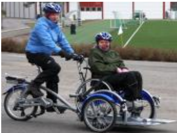
KUVIO 13. Pyörätuolinkuljetuspyörä Velo-Plus 2.