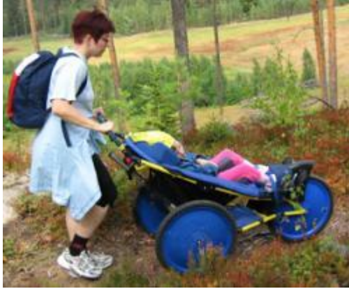
KUVIO 8. Kangoo monitoimirattaat

Kangoo monitoimirattaat (KUVIO 8) toimii maastossa, lumella, jäällä, asfaltilla ja polkupyörän peräkärrynä. Sitä on saatavissa kolmea eri kokoa ja rattaiden kokonaispaino on 14,5 kg. Monitoimirattaat sopivat niille vaikeavammaisille aikuisille, jotka tarvitsevat vahvan tuen vartalolle ja niskalle. Etupuolelle on mahdollista vaihtaa isompi eturengas, pienempi juoksupyörä tai polkupyörän vetoaisa. Ttalvi-keleissä renkaaseen voidaan kiinnittää suksikotelo tai luistinterä. Rattaat sopivat hyvin maastossa liikkumiseen, koska niissä on hyvä iskunvaimennus ja istuma-asennon kaltevuuden säätömahdollisuus sekä turvavyö ja sade- ja hyttysuoja. (Välineet.fi 2011.)