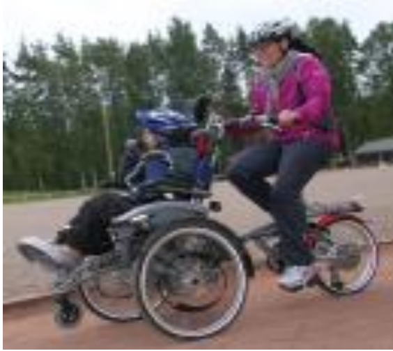
KUVIO 12. Yhdistelmäpyörä.