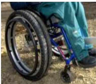
KUVIO 6. Maastorenkaat.

Nokkapyörä (MTC tai Sticker Lomo) (KUVIO 5) on pyörätuolin eteen kiinnitettävä lisäpyörä, joka nostaa pyörätuolin pienet tukipyörät ilmaan. Siten pyörätuolilla liikkuminen maastossa on helpompaa. Tukipyörien noston myötä kivien ja kantojen ylittäminen helpottuu ja liikkuminen sohjossa ja pehmeässä maastossa on kevyempää. Nokkapyörä voidaan kiinnittää pikalukituksella jalkatukiputkiin silloin kun pyörätuolissa on kiinteät jalkatuet. Jos pyörätuolissa on irrotettavat jalkatuet, nokkapyörä kiinnitetään pyörätuolin runkoon. (Välineet.fi 2011.)