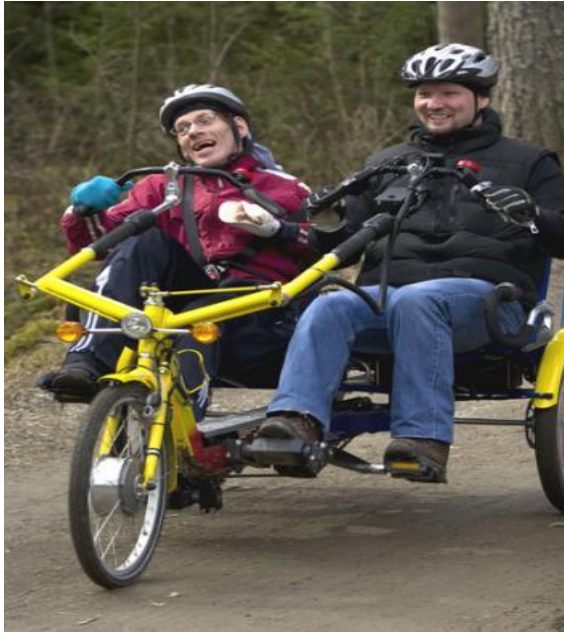
KUVIO 11. Rinnakkain poljettava pyörä

Rinnakkain poljettavassa pyörässä (KUVIO 11) pyöräilijät istuvat samalla tasolla, jolloin keskustelu ja vaikeavammaisen pyöräilijän seuraaminen on helpompaa. Pyörässä on mahdollisuus valita polkeminen ja ohjaus itsenäisesti tai yhdessä vierustoverin kanssa. Matalan painopisteen ansiosta pyörään on helppo päästä, se antaa vakaan ajokokemuksen ja lisää turvallisuuden tunnetta. Käsikahvat ovat taitettavissa eteen, jolloin istumaan pääsy helpottuu. Yhdistelmäpyörässä (KUVIO 12) etuosan saa irrotettua erikseen pyörätuoliksi. Se soveltuu henkilölle, joka ei pysty polkemaan tai ohjaamaan pyörää. Istuimessa on säädettävät sivu- ja niskatuulet, nelipistevyö ja jalkatuissa on säätömahdollisuus. Pyörätuolinkuljetuspyörä (KUVIO 13) mahdollistaa pyöräilyn silloin, kun omasta pyörätuolista siirtyminen ei ole mahdollista suuren tuentarpeen tai vaikean virheasennon vuoksi. Henkilön oma pyörätuoli kiinnitetään etuosassa olevaan tasoon kiinnitysjärjestelmällä. Pyörä vaatii leveytensä vuoksi suuren kääntösäteen. Kaikissa polkupyörissä on sähköinen apumoottori, joka helpottaa polkemista esimerkiksi ylämäessä tai suurikokoisen henkilön kanssa. (Välineet.fi 2011.)