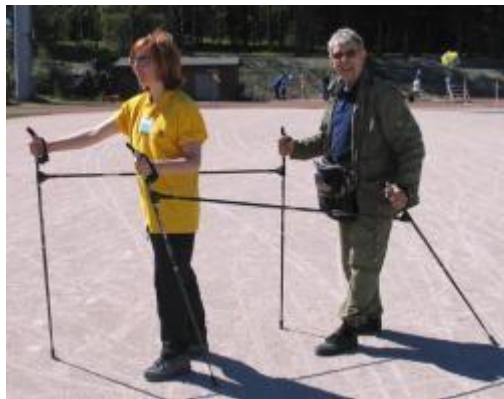
KUVIO 4. Tandemkävelysauvat

Tandemkävelysauvat (KUVIO 4) ovat nivelrakenteelle toisiinsa kytketyt parisau- vat, joita yhdistää 120 cm pitkä välipuomi. Kävelysauvoja voidaan käyttää vie- rekkäin tai peräkkäin. (Välineet.fi 2011.) Sauvakävely on hyvä liikkumisen vaih- toehto myös niillä kuntoutujilla joilla on ylipainoa, nivelrikkoa tai tasapainovai- keuksia. Parisauvat soveltuvat hyvin myös näkövammaiselle, jolloin näkevä kul- kee edessä ja näkövammainen takana. Tandemsauvakävely kehittää monipuolises- ti tasapainoa ja motoriikkaa. Sauvojen avulla on hyvä harjoitella kävelyn rytmitys- tä ja vauhtia. Kävelyssä sauvat ohjaavat vartalon painopistettä ja pehmentävät kantaiskua. Sauvakävely on noin 20 prosenttia tehokkaampaa kuin tavallinen kä- vely kun sauvatekniikka on oikeanlainen. (Arvonen & Palmén 2005, 71-72.)