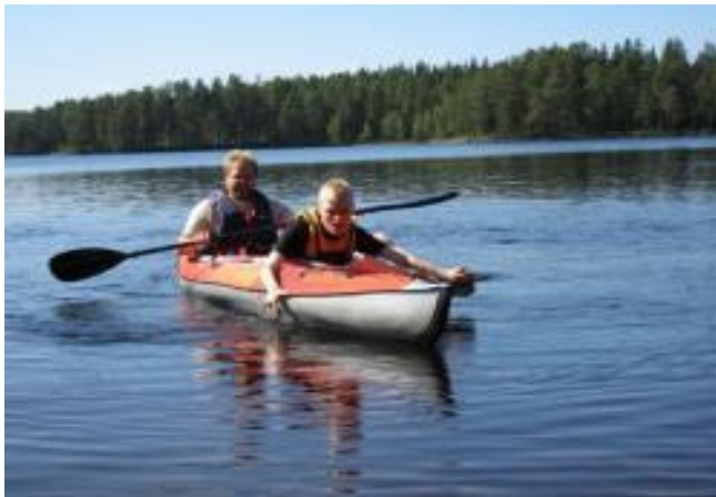
KUVIO 14. Ilmatäytteinen kajakki

Jokaiselle kuntoutujalle on mahdollista rakentaa yksilölliset ratkaisut, joiden avulla istuma-asento ja melominen ovat mahdollista. Istuma-asentoa voidaan tukea erilaisten tyhjiötyynyjen sekä solu- ja vaahtomuovien avulla tai vaikka laittamalla kanootin pohjalle säkkituoli. Tärkeää on muistaa, että melojaa ei koskaan saa sitoa kajakkiin. Kanootin tai kajakin sivuttaisvakautta voidaan tukea erilaisten sivukelkukkeiden avulla. Melan paksunnos tai melontahanska voi auttaa otteen pysymisessä tai tarvittaessa mela voidaan kiinnittää erilliseen tukivarteen. (Kuutamo 2005.)