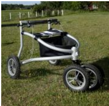
KUVIO 9. Maastorollaattori Trionic Walker

Kangoo monitoimirattaat (KUVIO 8) toimii maastossa, lumella, jäällä, asfaltilla ja polkupyörän peräkärrynä. Sitä on saatavissa kolmea eri kokoa ja rattaiden kokonaispaino on 14,5 kg. Monitoimirattaat sopivat niille vaikeavammaisille aikuisille, jotka tarvitsevat vahvan tuen vartalolle ja niskalle. Etupuolelle on mahdollista vaihtaa isompi eturengas, pienempi juoksupyörä tai polkupyörän vetoaisa. Ttalvi-keleissä renkaaseen voidaan kiinnittää suksikotelo tai luistinterä. Rattaat sopivat hyvin maastossa liikkumiseen, koska niissä on hyvä iskunvaimennus ja istuma-asennon kaltevuuden säätömahdollisuus sekä turvavyö ja sade- ja hyttysuoja. (Välineet.fi 2011.)